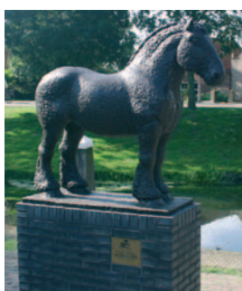
Heenvliet heeft van alles te doen met paarden, o.a. de jaarlijkse Paardenmarkt op 2e Pinksterdag.